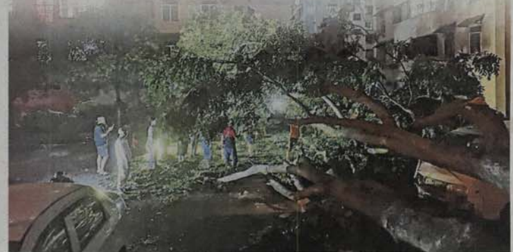
■暴风雨吹袭加影区，造成百宗树倒的投诉，一些大树更是因强风而连根拔起。

是在午间6时许来袭，狂风退去后，市议会接获超过百宗各大小树倒毁屋的投诉，亦是市议会未曾有过的纪录。