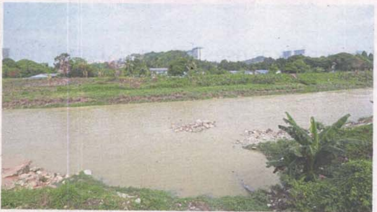
Murky waterways as seen here of Sungai Klang is a sign of pollution in Kuala Lumpur's rivers and one of the contributing factors is sand washing.