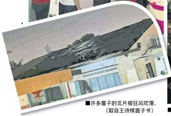
■许多屋子的瓦片被狂风吹落。