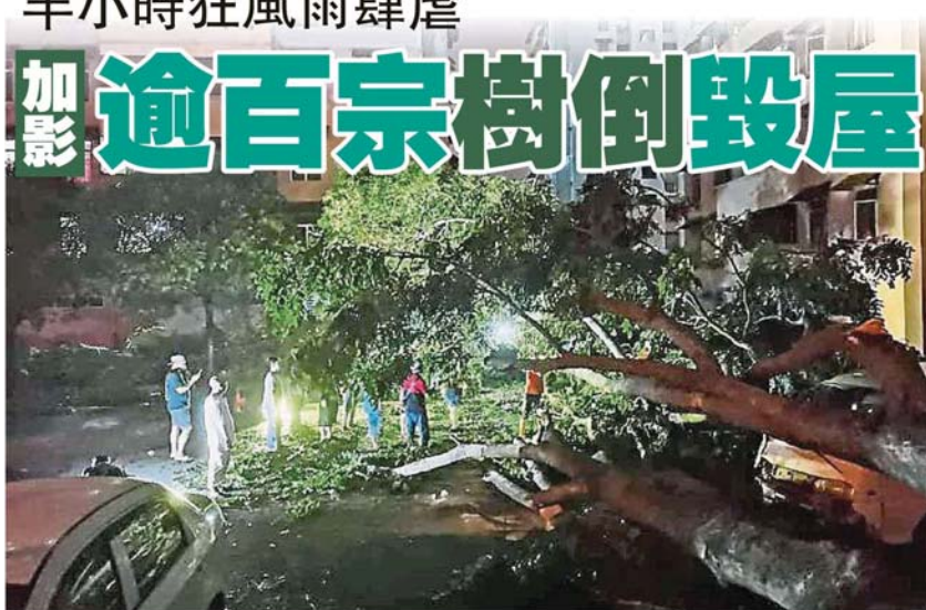
昨午暴風雨吹襲加影區，造成超過百宗樹倒毀屋，一些大樹被連根拔起。

(加影8日訊)只是區區半小時強風帶雨襲擊，加影市議會轄區多個地方在昨午就受到不小的破壞，大量樹木被吹倒，至少有50間住屋受到不同程度的損壞。