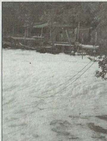
网民声称, 当地已不是第一次发生「积雪」现象。

有关甘榜水闸河面「积雪」的照片于上周末晚上被上载到面子书 (Klangkampunghalamanku) 专页后, 引起议论。部分网民留言调侃, 指我国常年大热天气,