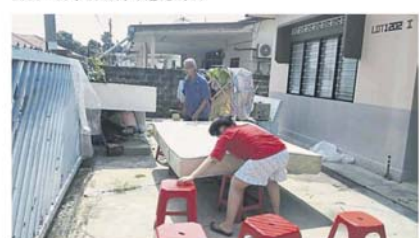
床褥被雨水淋湿后，屋主只好抬到院晒干。

无拉港州议员王诗棋说，首都镇大沟改善工程分两个阶段进行，首阶段工程已完成，目前进行的第二阶段工程进行了85%，她会向市议会工程组反映，要求发展商尽速完成该工程。