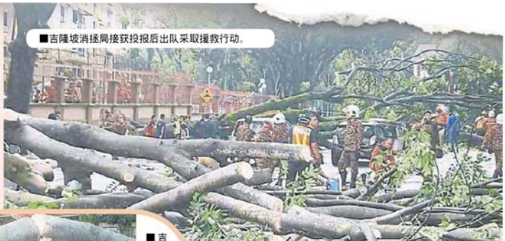
■吉隆坡消防局接获投报后出队采取救援行动。