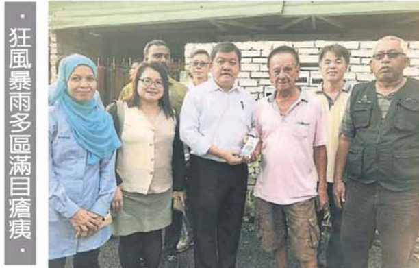
狂風暴雨多區滿目瘡痍