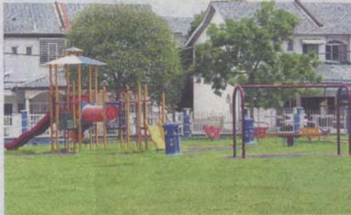
MPSJ has been told to be consistent in maintenance of playgrounds in Subang Jaya.