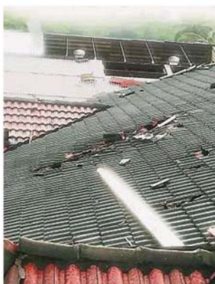
一些地區的住宅區遭狂風破壞，屋頂被吹走。