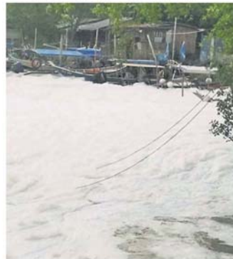
大量白色泡沫堆满码头，渔船几乎无法移动。

雪州行政议员许来贤说，有关现象于4月5日出现，当时，雪州政府接获投报后，便已指示环境局(JAS)和雪州水供管理机构(LUAS)到当地考察和了解起因。