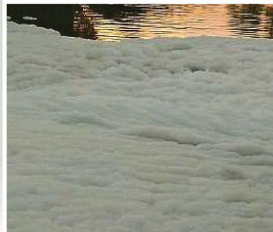
↑巴生甘榜德叻水闸附近的渔船码头一带于上周突然冒出一大片白色泡沫，犹如积雪。

他说，环境局和雪州水务管理机构会到现场抽取水质进行化验，以追查水闸和河口的水质是否遭受的污染，才能追查河面出现泡沫的真正原因。