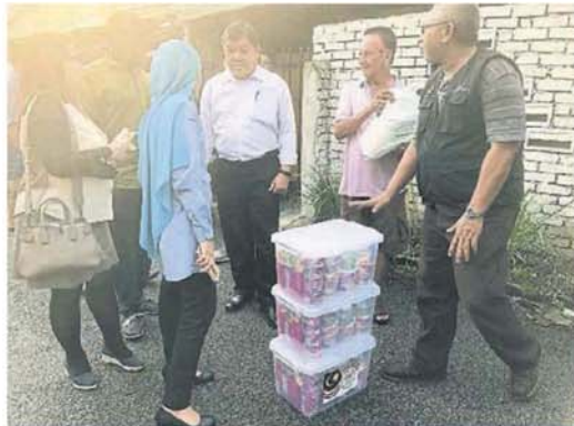
国家天灾管理局准备一些食品给灾民。