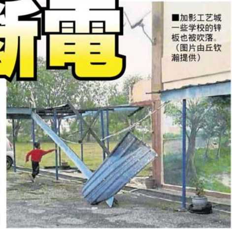
■加影工艺城一些学校的铁板也被吹落。