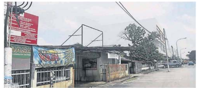
有竖立泊车收费的告示牌，就表示在该地区泊车需要缴付。