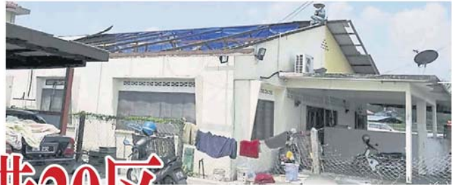
锡米山查雅花园后面的房屋，整片锌板被大风吹走。