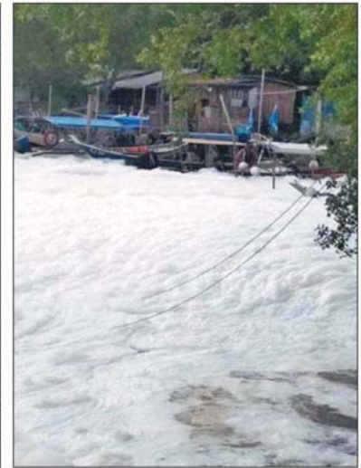
甘榜德列水闸处出现雪花，近看才能辨认出是泡沫。