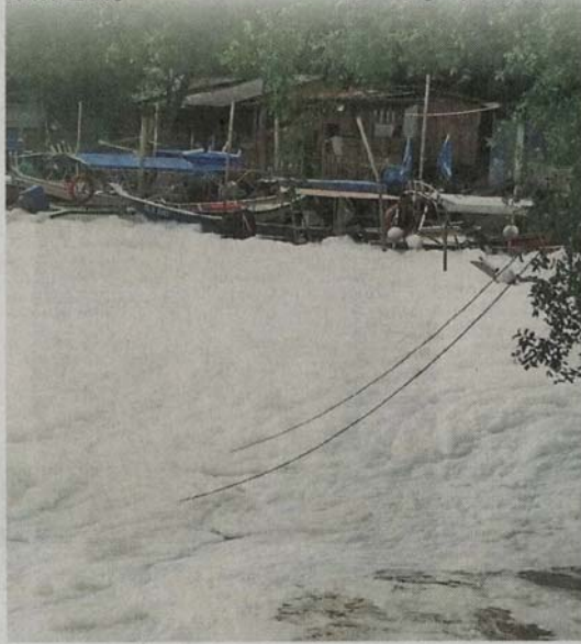
■巴生甘榜德叻水闸附近的渔船码头一带于上周突然冒出一大片白色泡沫，犹如积雪！