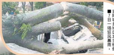
吉隆坡多地区发生树倒压坏车事故。7日一场狂风暴雨。