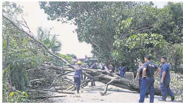
加影市议会人员在锡米山休闲湖旁，把倒在路中的大树锯断以便清理。

在锡米山新村1路和6路、仙水港村、仙水港往Jade Hill方向、锡米山大道、斯巴