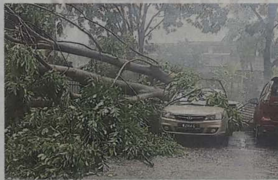
■一些轿车遭大树压中，损失惨重。

(加影8日讯) 近日来的天气变化莫测，昨午一场为时不到半小时的强风雨，便导致加影市议会辖区多个地点遭到破坏，除了树木被大风吹倒外，至少有50间住宅单位也受到不同程度的影响。