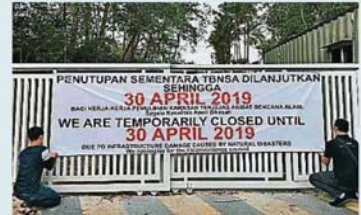
沙亚南国家植物园为修复3月发生的树倒事件, 而将关闭至4月30日。