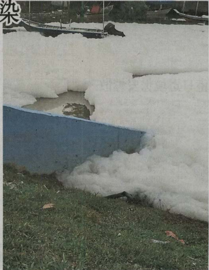
■堆积的白色泡沫非常厚，宛如河面结成冰霜。