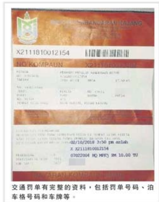
交通罚单有完整的资料，包括罚单号码、泊车格号码和车牌等。

面对面的整 10 个泊车位。商家说，该处的泊车位原本有号码的，消失后也没马上重划，而这地区的抄牌员也很勤力抄写罚单。