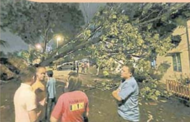
■蕉赖乌达玛多棵大树倒下。