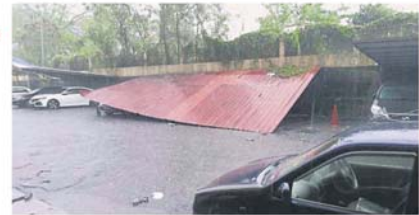
停车棚也被大风吹倒。