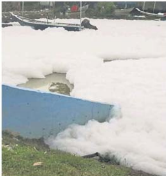
渔船几乎被泡沫包围，动弹不得。