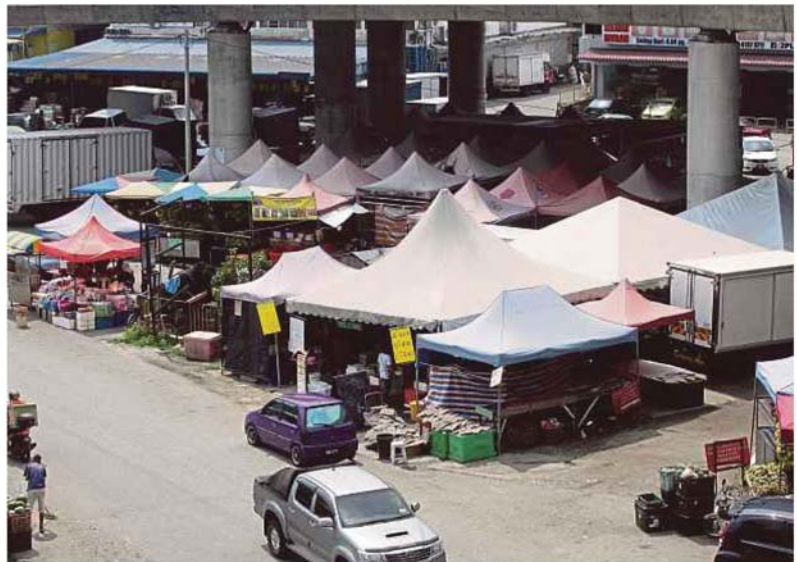
Keadaan premis milik peniaga warga asing yang menjalankan perniagaan tanpa lesen di bahu jalan sekitar Pasar Borong Selayang, Kuala Lumpur.