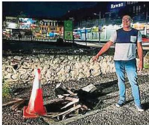
万挠霸级超市后巷的铁沟盖甫于3月23日(左图)补上,但未及两周便已不翼而飞。