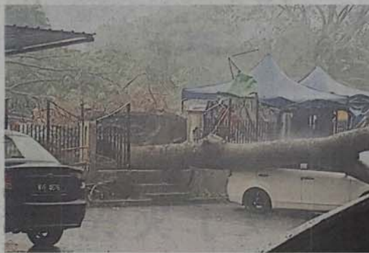
■大树挡不住强风的吹袭，应声倒下。