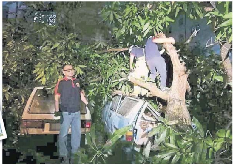
■志愿消防队员合力砍树，移走压在车上的树干。