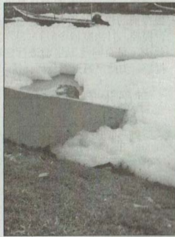
甘榜德列水闸处出现雪花, 近看才能辨认出是泡沫。

此外, 另一名巴生市议员, 即土团党党鞭霍兹表示, 本身被告知当地出现的白色水泡, 乃因化学物质所致, 因此环境局已经派官员到现场调查原因。