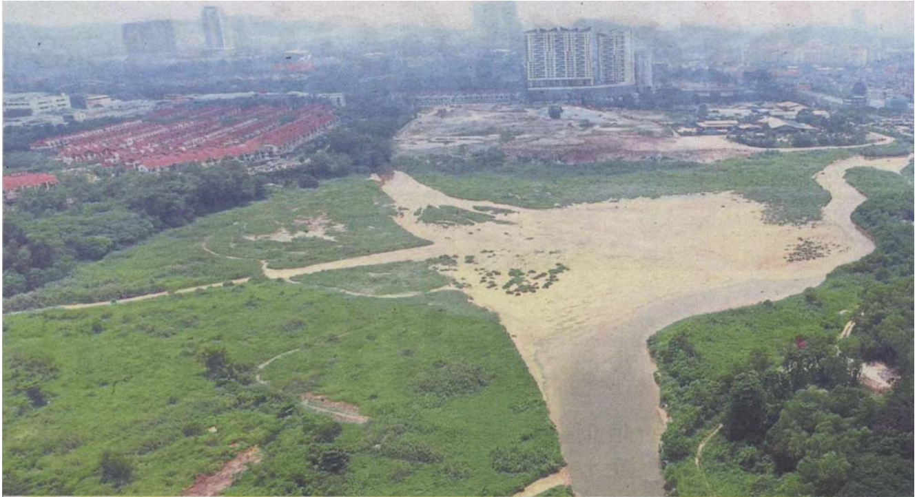
An aerial view of the Kampung Bohol flood retention pond. The silting (yellowed water) is an obvious effect of sand washing activity which also causes other forms of pollution that endanger people's health.