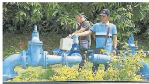
↑ SELESA RESORT 度假村居民投訴被鎖的輸水管。