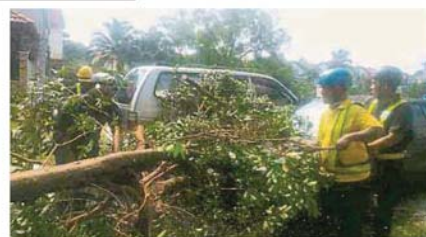
區進行清理工作。市議會調派多個部門人手在各地。