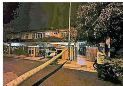
民受傷事故。大樹倒下直接壓中住家，幸好沒有傳出傷。